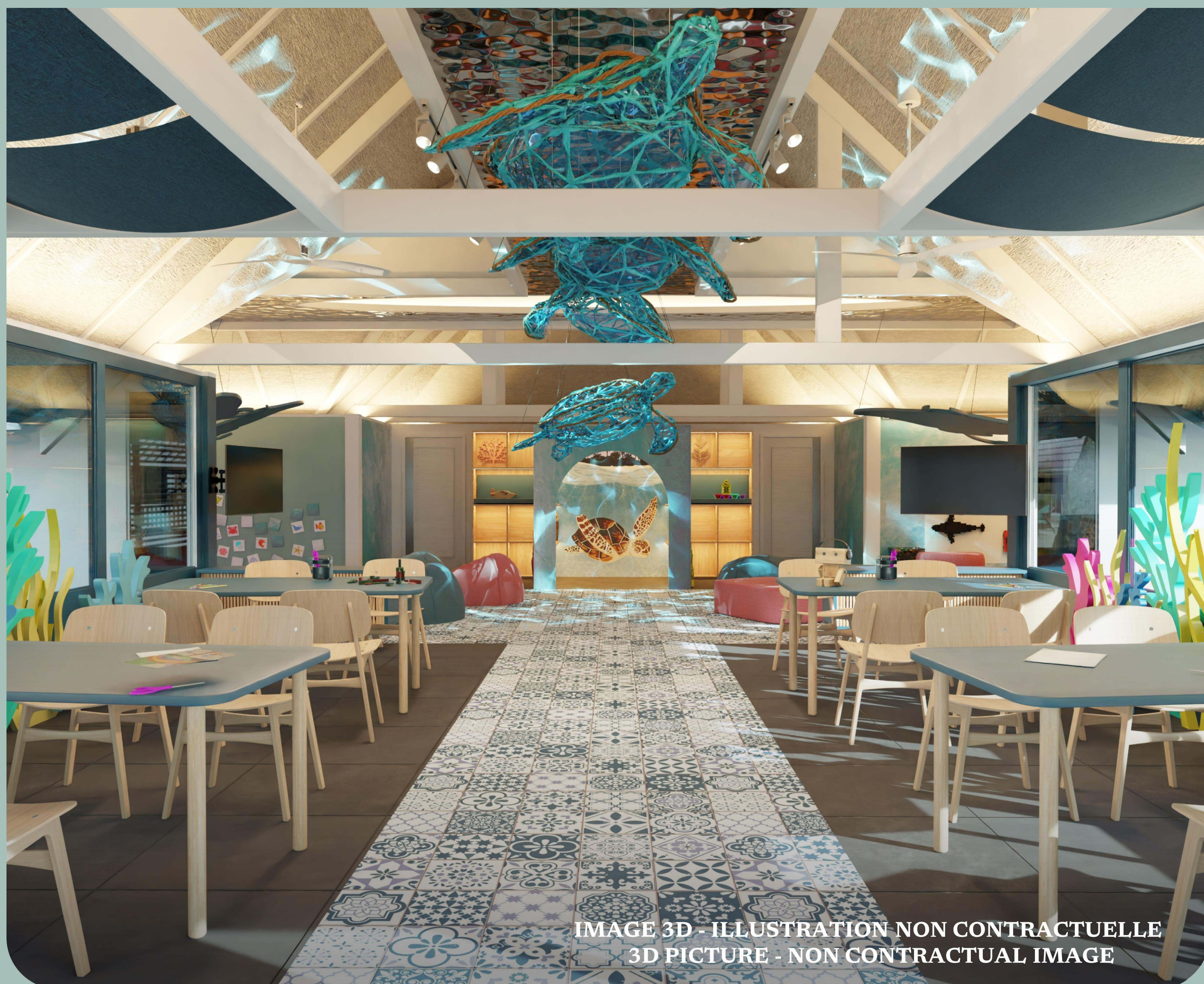
IMAGE 3D - ILLUSTRATION NON CONTRACTUELLE 3D PICTURE - NON CONTRACTUAL IMAGE

Club Med 卡尼島將於 2025 年迎來全新計畫，「海洋中心（ Marine Conservation Hub ）」，這是一座結合教育、互動與永續精神的嶄新設施，誠邀每位旅客一同深入認識我們對環境保護的承諾。 透過互動展區、環境教育課程與由 Green G.O. 親自帶領的工作坊，旅客將有機會近距離了解馬爾地夫珍貴的海洋生態，以及保護這片美麗海域的重要性。 這不只是一處學習空間，更是一段與自然共鳴的旅程。讓我們一起從度假開始，為海洋守護一份永續未來。